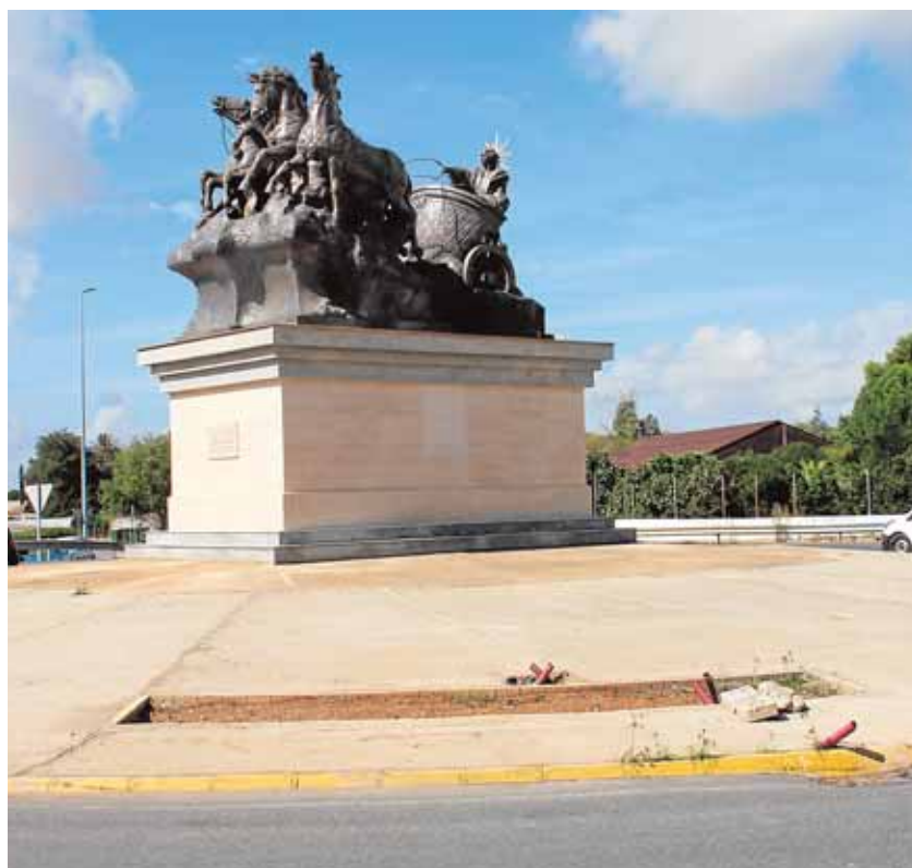
Estado actual de la rotonda de la cuádriga de Sanlúcar la Mayor