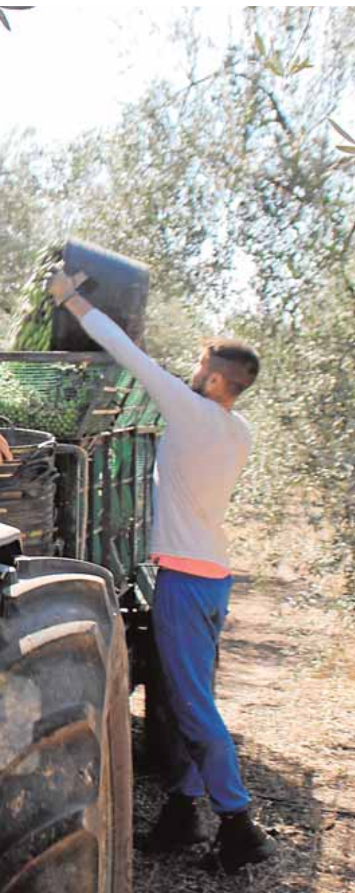
Para llevarlas a la cooperativa

cerebral en Sevilla, colocará una mesa informativa en el mercadillo local de Umbrete el martes 27 de octubre. Además, el lunes 26, dentro de la Semana de la Salud, habrá una charla conferencia sobre este asunto en el salón de plenos.