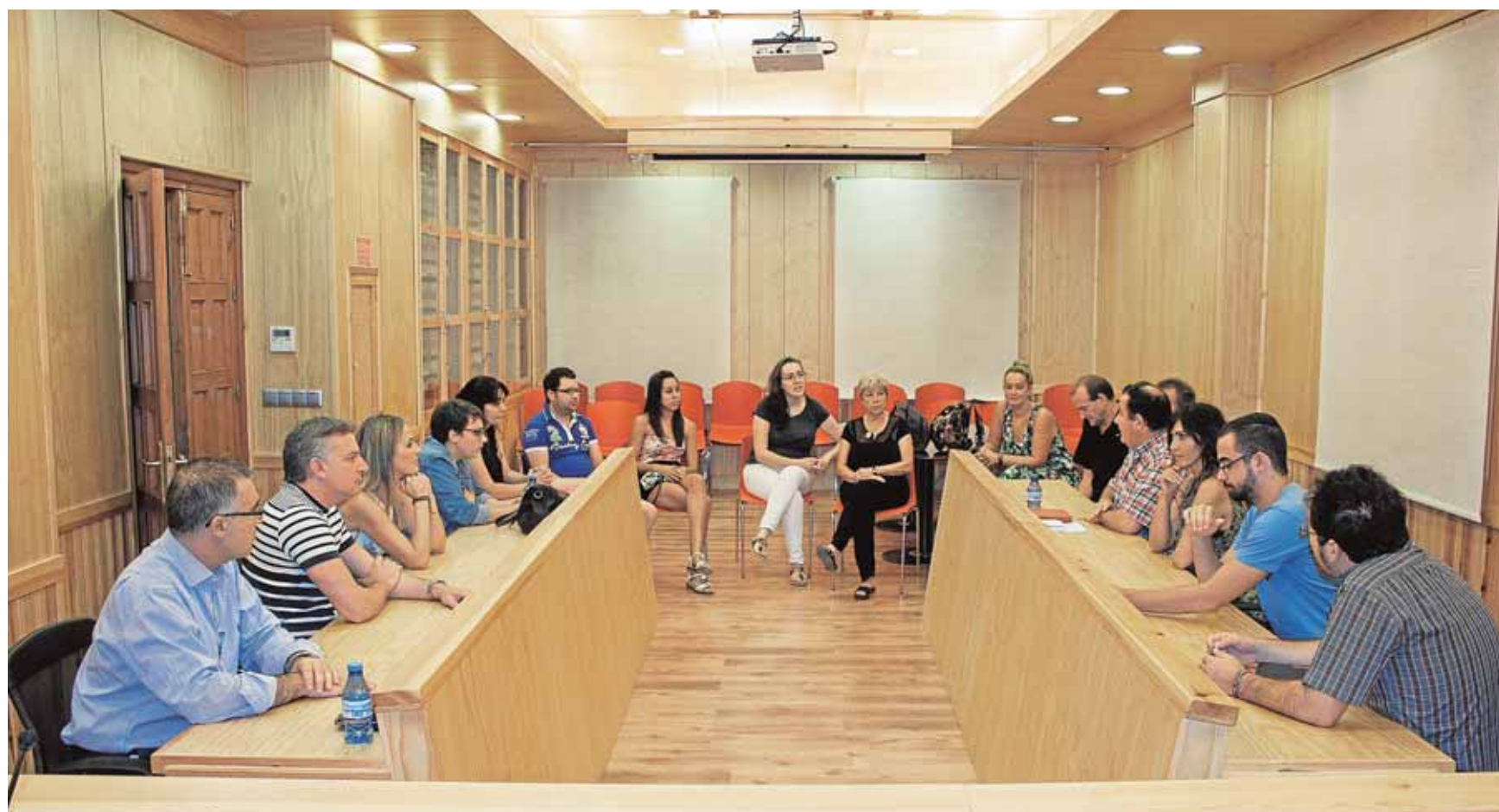
Alcaldes de la Sierra Sur y plataformas vecinales se reunieron esta semana en La Roda de Andalucía para unificar sus propuestas.

saonense el certificado de excelencia 2015. Las votaciones realizadas por los usuarios de este buscador han concedido a la Colegiata 4,5 puntos sobre 5, lo que le permitirá lucir distintivos en español e inglés para su identificación en la localidad. B.M.