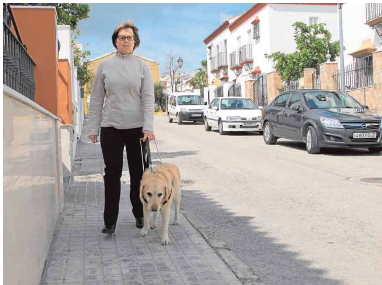
Los propietarios de perros guías no podrán ser multados por no recoger los excrementos de sus lazarillos

Los propietarios de perros guías han quedado exentos de ser sancionados por la no recogida de los excrementos de sus animales lazarillos.