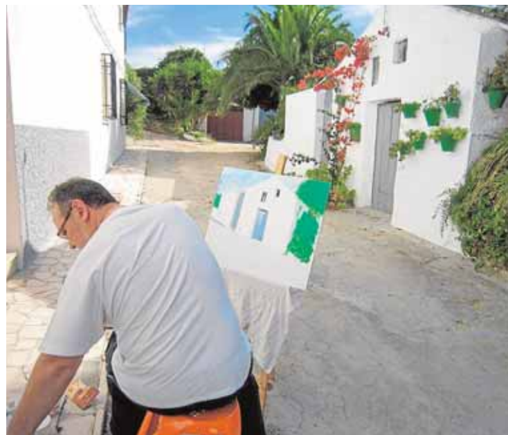
Los pintores usarán los rincones de Gilena para sus cuadros.