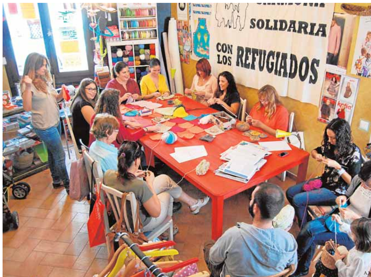
La mercería creativa Serendipia acoge la iniciativa y enseña las técnicas de costura

El día 16 de octubre habrá una jornada en la sede de la Olavide que contarán con el testimonio de un refugiado y el 14 de noviembre junto con Caritas harán un espectáculo en el teatro Cerezo para recaudar fondos.