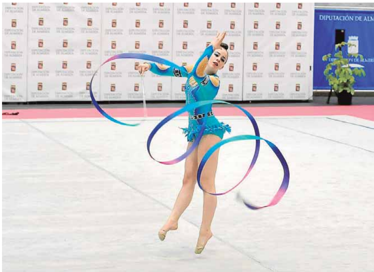
Las chicas del Rítmica Maharana fueron el equipo andaluz mejor puntuado en los nacionales

bre y noviembre a través de la iniciativa Andalucía Compromiso Digital. Presentaciones, ofimática, redes sociales y creación de blogs y webs son la oferta de estos cursos cuyas solicitudes pueden recogerse desde hoy mismo en Desarrollo.