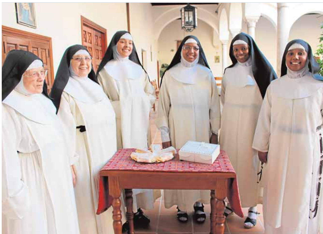
Las hermanas dominicas en el patio del monasterio de clausura muestran los bizcochos

y otro de manipulación de alimentos. El primero de ellos tendrá una duración de 20 horas y dará comienzo el 27 de octubre, con inscripciones hasta el día 19; mientras que el segundo, de 35 horas, se iniciará el día 23, con inscripciones hasta el 15.