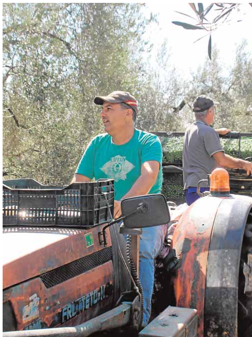
Momento de la llegada del tractor, donde se vuelcan los cubos con las aceitunas, pa

«La cosecha ha sido muy mala y se obtendrá en torno al 40% de lo recogido el año pasado», afirma Silva