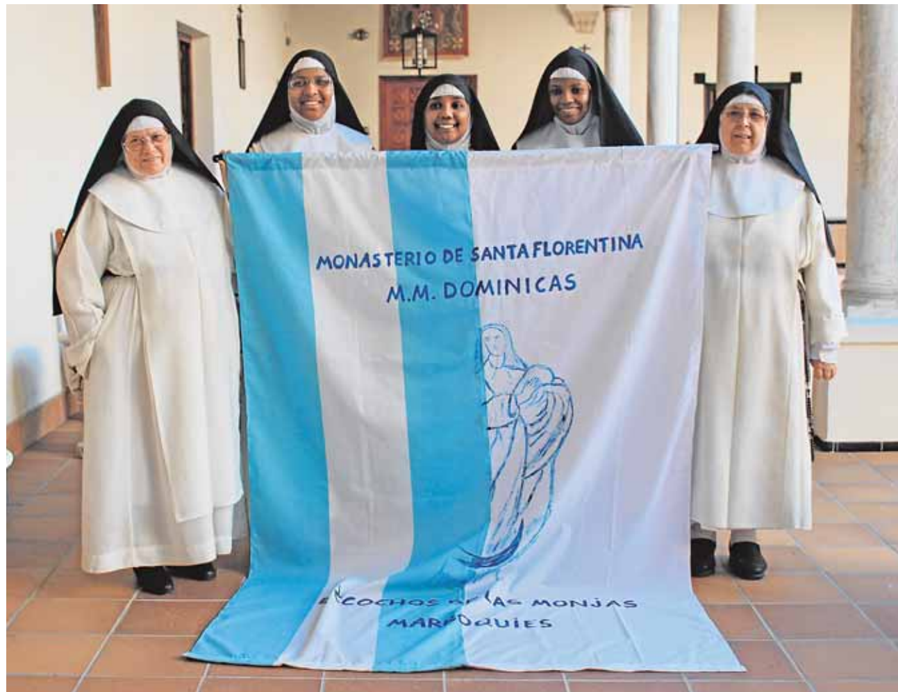
Monjas dominicas de Ecija venderán sus bizcochos marroquíes durante la Magna Mariana de este domingo