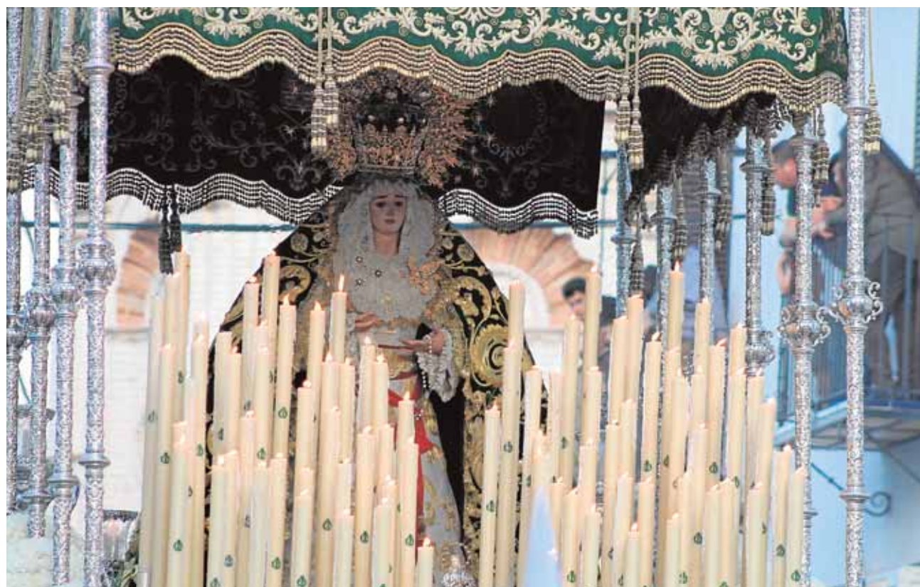
Un total de 17 imágenes marianas dolorosas y de gloria desfilarán en la procesión extraordinaria

La carrera oficial comenzará a las 19.00 horas y finalizará tres horas después, a las 21.56 horas, con el paso de la Virgen de la Amargura.